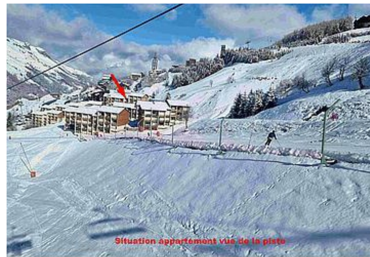
Situation appartement vue de la piste