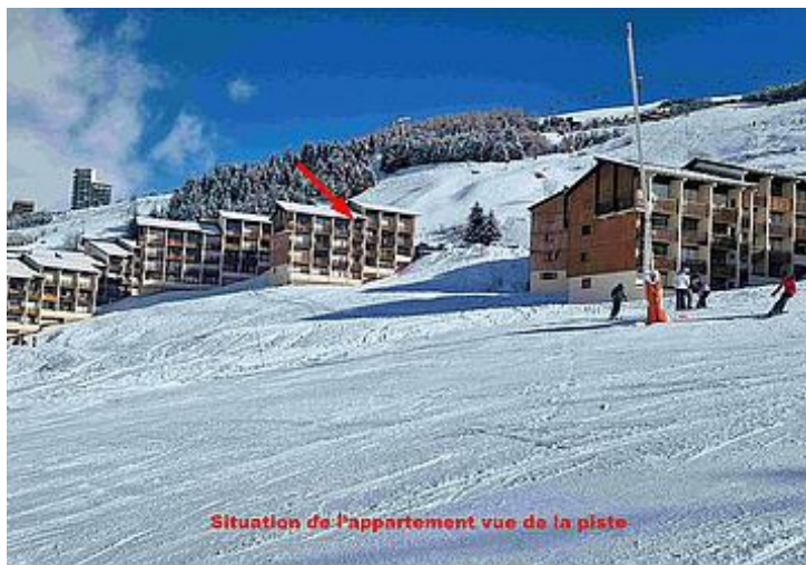
Situation de l'appartement vue de la piste