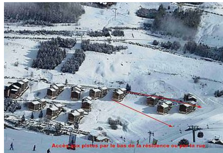
Accès aux pistes par le bas de la résidence ou par la rue