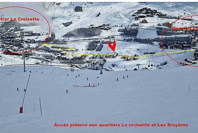
Accès piétons aux quartiers La croisette et Les Bruyères